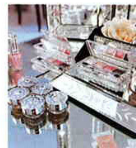
↑秋冬の新ラインナップもずらり。←ブラッシュ プロテクター全5種 各4725円。写真はシアーピンク×ロマンティックピンクのフェミニンな組み合わせ。

フィット感を感じたもの。もちろん、花びらをモチーフにしたジュエリーのようなデザインも、女の子心をくすぐります。さらに、同時に登場する秋冬コレクションは、スモーキーカラーなどシックなテイストを取り入れることで、大人可愛さを演出。どちらも、ポーチにのっけるだけで幸せな気分になれること請け合いです。